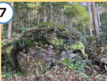
カッパ岩と呼ばれている。