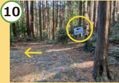
この分岐点を左へ。