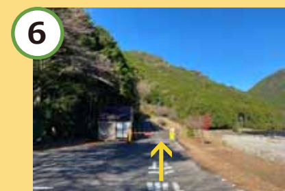
6 ゲートを越えて左上へ。