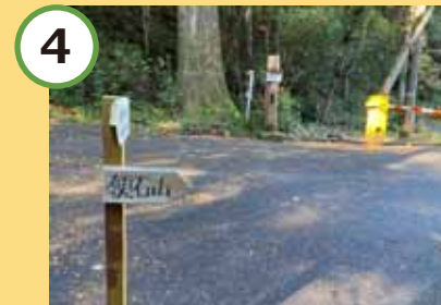
4 右折し銚子川沿いを進もう。