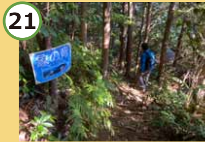
少し道を下ります。