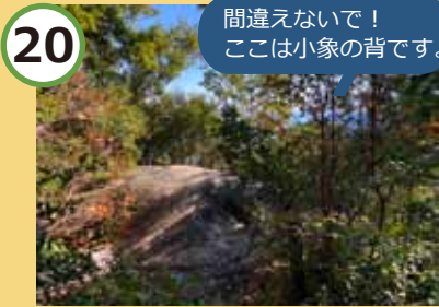
途中、少し大きな岩が。