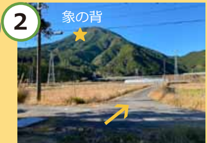
2 象の背 駐車場西側へ。目指せ★！