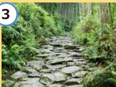
石畳の道はとても神秘的。