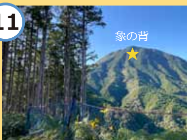
途中右方向に象の背が！