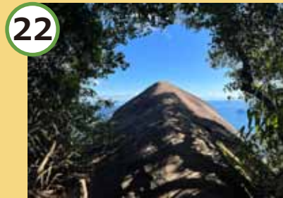
ついにやってきました。