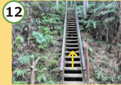
滑りやすいので気を付けて。 岩の右側を通り上へ。