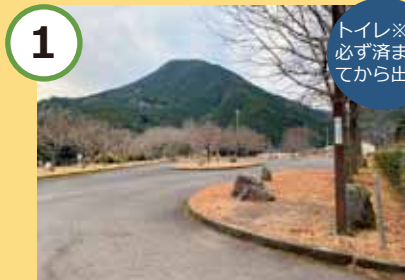
1 権兵衛の里駐車場出発！