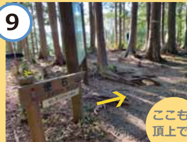
ここも頂上です 矢印の方向に下る道あり。