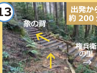
権兵衛の里ルートとの交差点。