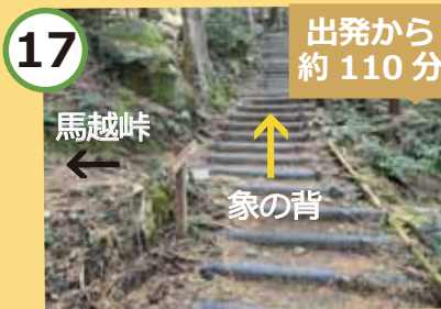
ルート②との分岐点。