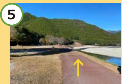
5 キャンプ場の敷地内は静かに。