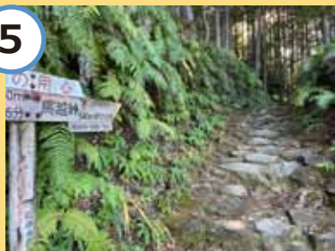
林道との交差点に到着。