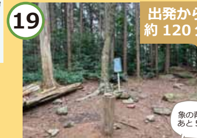
便石山頂上に到着。