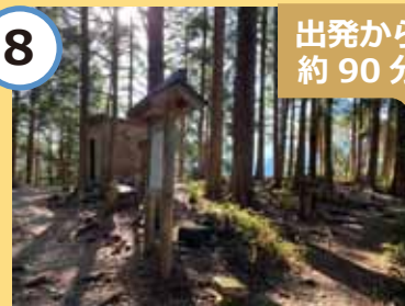
馬越峠の頂上に到着。