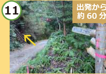
林道との交差点へ到着。