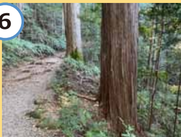
檜と杉の巨木も必見。