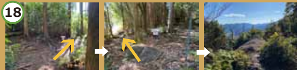
右へ進む。 分かれ道を左へ。 わずか 2 分で到着。