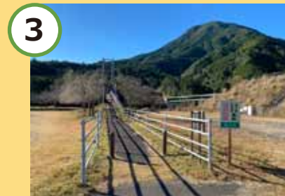
3 吊橋を渡って道なりに。