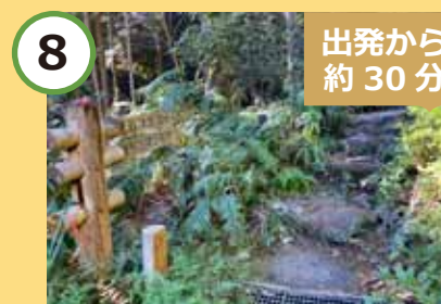
8 便石山登り口です。