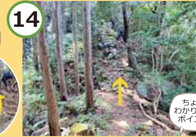
岩の上をどんどん進む。