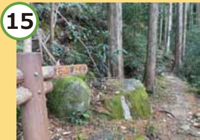
便石山頂上まであと 45 分。