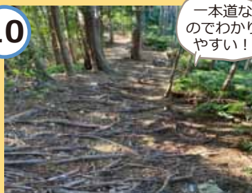
尾根沿いを歩いていきます。