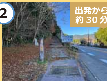
馬越峠登り口に到着。